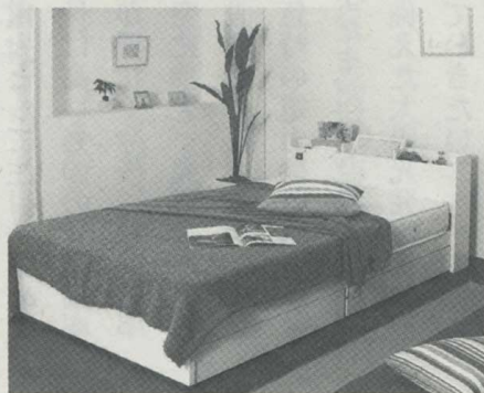
低価格で寝心地も良い国産ベッド

来年創業五十周年を迎える同社は「ニーズに合った商品をタイムリーに生産、販売するを以って社会貢献を成す」を企業理念にしており、五年に一度の